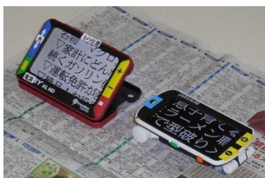
携帯型拡大読書器