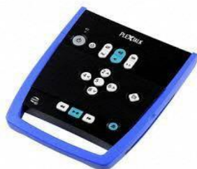
音訳図書再生機器